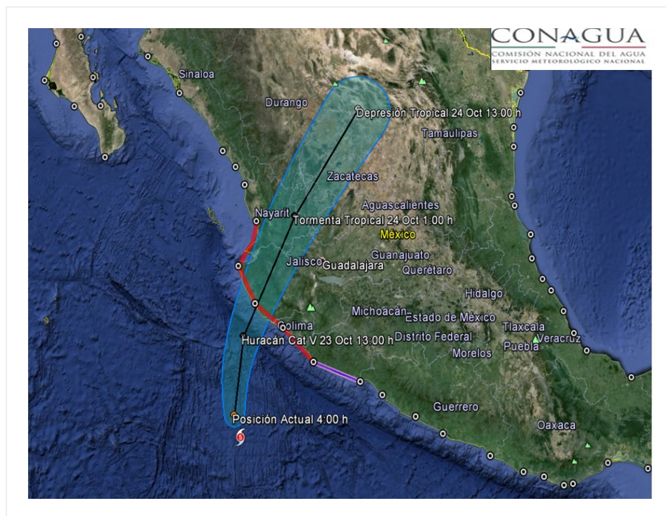
Trayectoria pronóstico del huracán PATRICIA (categoría 5).